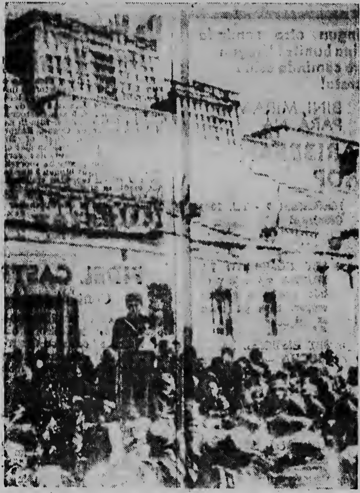
LEYNAN ROJO. — Un agente Comunista Chines ta para mas adlanti di e palacio di e Dalai Lama na Lhasa mientras e ta leza un edicto di Peiping. Tibetanonan ta scucha.